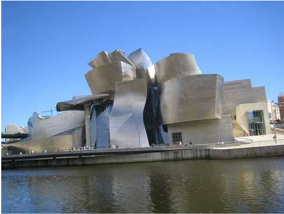
Guggenheim museoaren ikuspegia